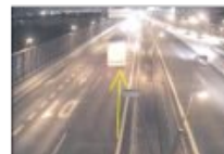
Foto: Opitý kamionista jazdil v protismere po D1 v Bratislave, výzvy na zastavenie nerešpektoval

Návrhy rakúskeho predsedníctva v Rade EÚ o legislatívnych reguláciách v cestnej doprave a o vysielaní pracovníkov by podľa združení dopravcov ČESMAD Slovakia a ČESMAD Bohemia mohli byť za istých okolností „svetlom na konci tunela“.