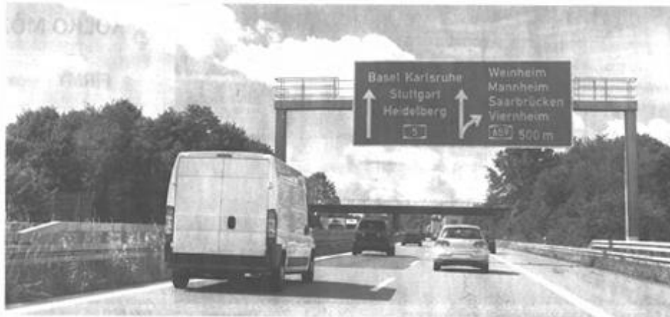
Nemecko chce spoplatnením ďalších ciest získať viac peňazí na ich údržbu.