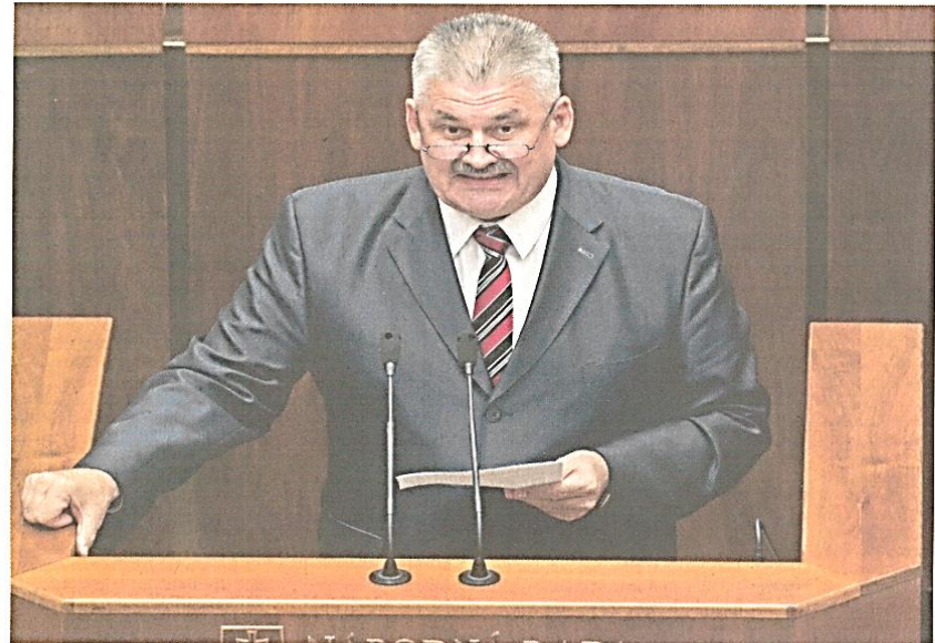
Minister práce Ján Richter chce uľahčiť zamestnávanie v nedostatkových profesiách.